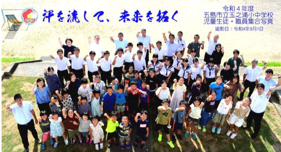
令和4年度 五島市立玉之浦小中学校 児童生徒・職員集合写真 撮影日：令和4年9月1日

に引き延ばして、額を付けて玄関に掲示しました。1学期は、全員が揃って撮影できる機会がなく、2学期初日にやっと撮影することができました。令和2年度から続けている全校集合写真ですが、3枚のパネルを並べてみると成長著しい子どもたちの姿がありま