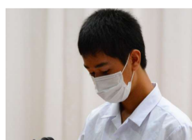
和輝さん 学級として2学期に頑張りたいことが3つあります。

まず「話しを聞くこと」です。自分たちのこととして聞き、行動できるようにしたいです。次に「発言に気を付けること」です。言葉を適切に遣い気持のよい学校生活を送りたいです。最後に「読みやすい文字を書くこと」です。読む人がいることを考えて丁寧に書くことを意識します。