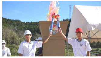
聖火台への点火また親子競技の点火を、デカパンから玉入れ、聖火台から玉入れ、玉転がしに変

今年度は、保護者・ご家族はもちろん、考えられる感染予防を行いながら、2年ぶりにご来賓・地域の皆様にもご案内いたしました。 子どもたちは、待機場所ではマスクを着用しましたが、十分な間隔を保ちながら行える競技や演技の間は、児童生徒数が少ない本校の強みと捉えてマスクを外し、声を出すことも制限しませんでした。また新しい競技種目を取り入れ、演出の変更も積極的に行いました。例えば入場行進