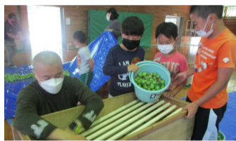
実の大きさで仕分け