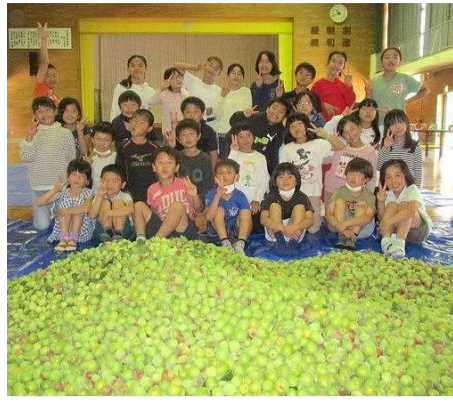
大きな実がたくさん採れました

5月27日(金)、旧平成小学校にある玉之浦小学校梅園で、梅の実採りを行いました。始めに、3・4年生が、「へびやダニに気をつけよう」など、安全に関わ