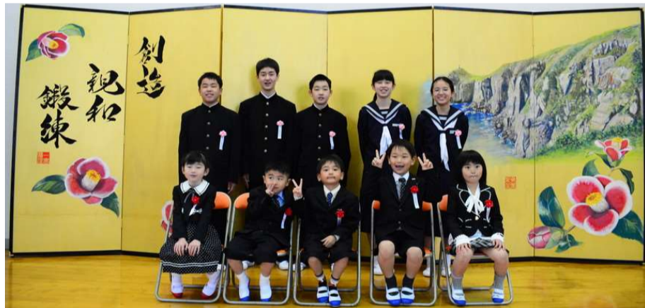
玉小中オリジナル屏風を背に、10名の新入生たち

2日前から式場設営に協力してくれた中学生。清掃や、教室・廊下に心づくしの飾り付けを行った小中学生。みんなで新入生の晴れ舞台を準備し、入学式の中でも、歓迎の気持ちを精一杯表現していました。誰かのため、汗を流すことわいがありました。