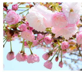
グラウンドの八重桜

4月6日(水)、転入生2名と転入職員5名を迎え、令和4年度が始動しました。翌7日(木)には、入学式を挙行し、小学校の新入生5名、中学校の新入生5名を迎えました。